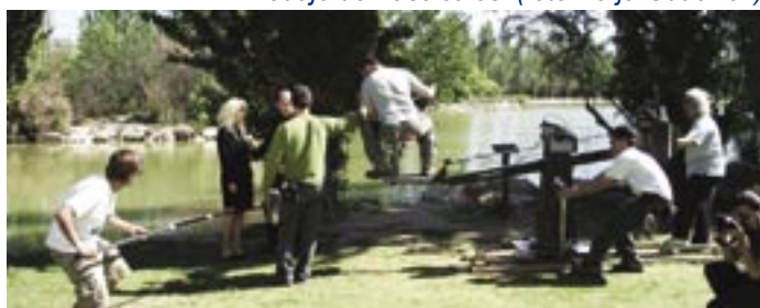
Rodaje de Fascículos.

El resultado tras su paso por las salas de postproducción está a punto de salir a la luz, momento que esperamos con expectación, pues por lo que han contado sus protagonistas el trabajo promete. 🎬