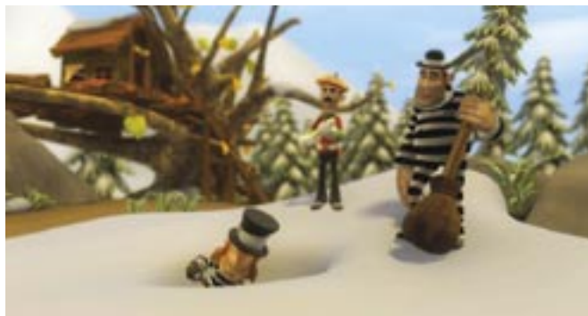
Olentzero y el tronco mágico

de verano las pruebas pertinentes de material negativo, a finales del mes de septiembre comenzó el trabajo de filmación que Septima Ars está llevando a cabo y que está previsto finalice en el mes de octubre.