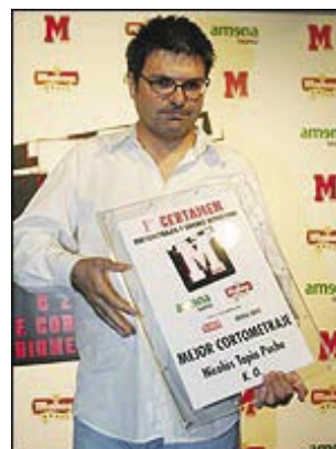
Entrega de premios

Nicolás Tapia es actualmente jefe de producción y ha trabajado en numerosos largometrajes, muchos de ellos a las órdenes de Pedro Almodóvar.